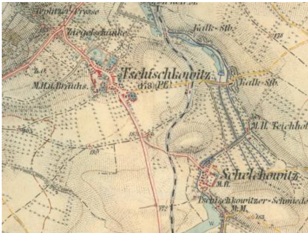
Photographie 1 Minute topographique à 1:25 000e de Roudnice nad Leben, Section 3852/1( http://austria-forum.org/images/aw/magnify-clip.png )