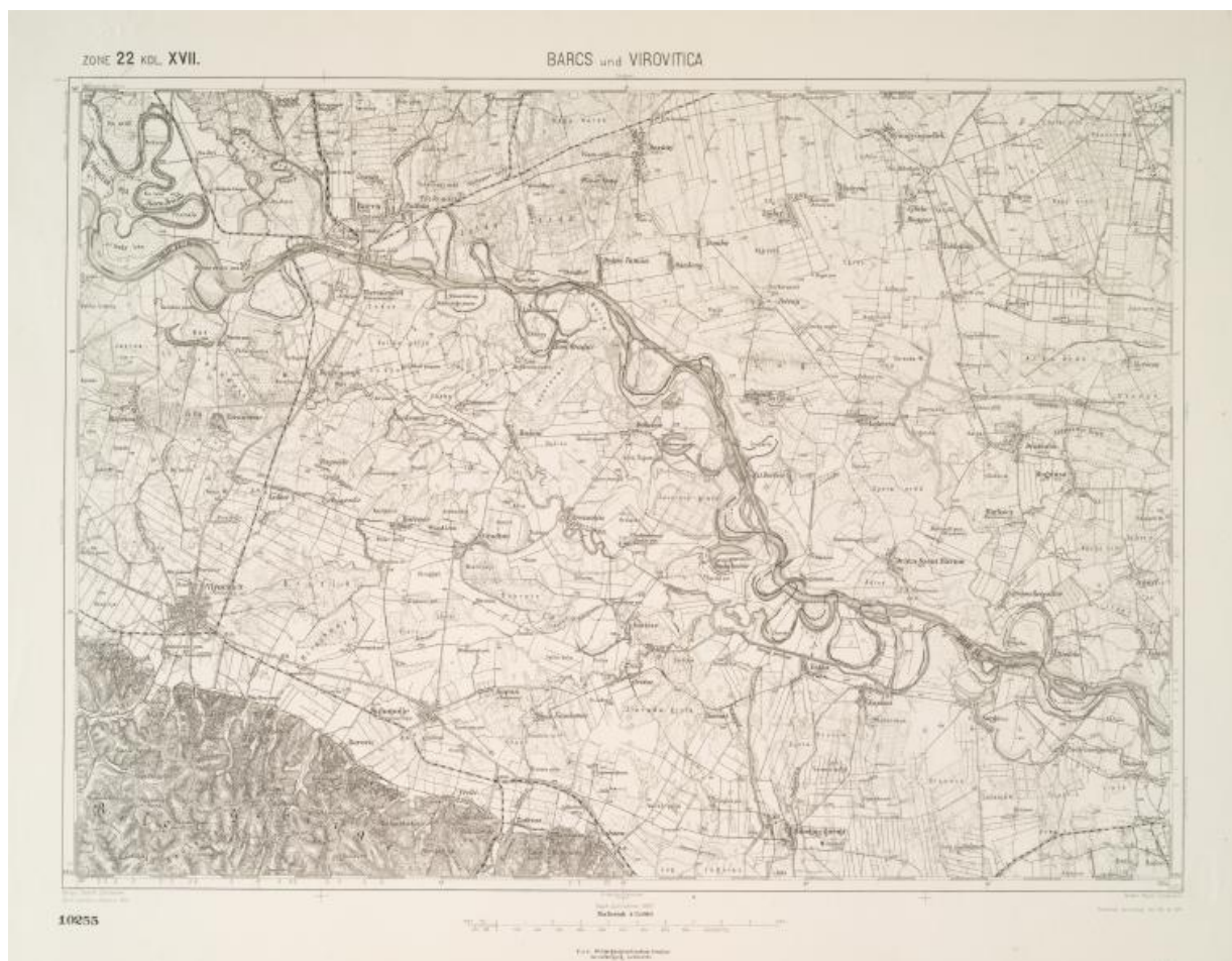
Photographie 2 Spezialkarte der Österreichisch-Ungarischen Monarchie, Maßstab 1:75 000. Zone 22, Kol. XVII, Barcs und Virovitica / K.u k. Militärgeographisches Institut ( http://austria-forum.org/images/aw/magnify-clip.png )

Cette série, était complète en 1890 + 31 feuilles à sa réédition en 1894 (=environ 780 feuilles). Elle a été publiée au rythme d'environ une feuille/semaine. Chaque feuille représente un territoire de 30 x 15 minutes. L'espace couvert va des frontières Nord - Sud : de Sluknov